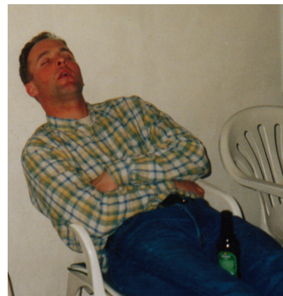
P.C. in gedachten bij zijn kippen

Ook Langeweg is getroffen door de dioxinekwesitie die, veroorzaakt door een dubieuze vetmelter uit België, de wereld al weken in zijn greep heeft. De Langewegse ondernemer P.C. met een mestkuikenstal voor 40000 van deze hapklare bouten had voer betrokken bij een bedrijf, wat mogelijk weer besmet vet had betrokken van een mottige Belg. Het directe gevolg was dat gedurende een periode van een week de deur op slot ging. Het werd P.C. allemaal wat teveel en hij zocht zijn heil bij Bacchus voor een gedegen advies inzake bovengenoemde kwestie. Het resultaat van dit advies spreekt voor zich.